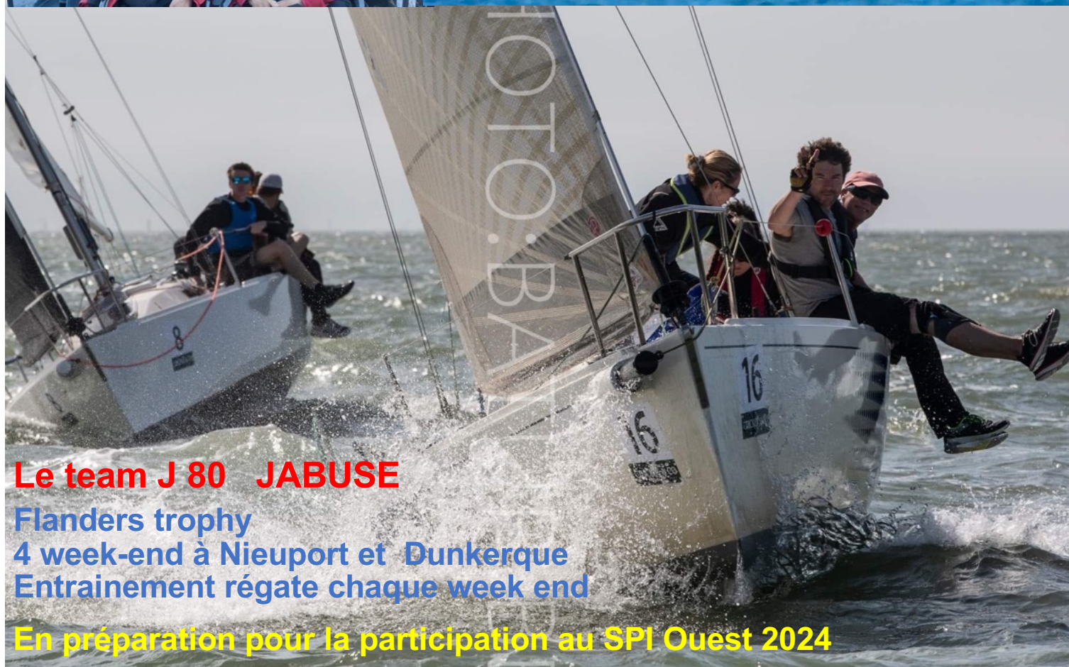
Le team J 80 JABUSE

OSTENDE –RAMSGATE -OSTENDE Seuls Français YCMN pour 35 voiliers au départ Tous les 2 sur le podium au classement général